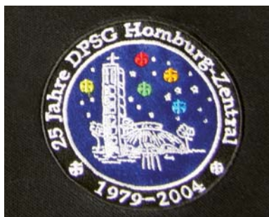
Stick auf Fruit of the Loom 65/35 Polo

* Bademäntel: Handlingszuschlag von 1,30 EUR / Stück (für alle Mengen)