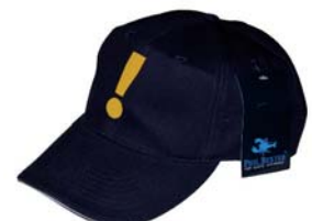
Flex-Druck auf Phil Bexter Cap