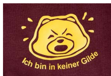
Flex-Druck auf Promodoro Premium-T