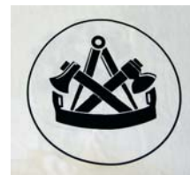
Siebdruck auf T-Shirt