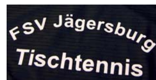
Flex-Druck auf Phil Bexter X-Champ Polo